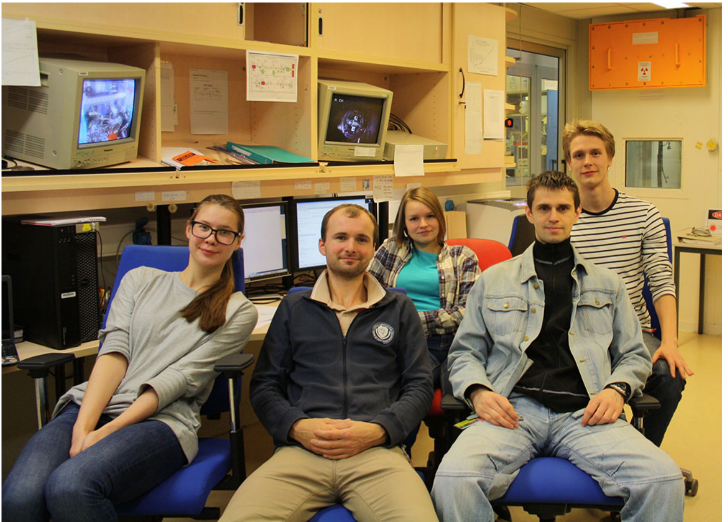
Конкурс 2017 года «Проведение исследований научными группами под руководством молодых ученых» Президентской программы исследовательских проектов, реализуемых ведущими учеными, в том числе молодыми учеными ФГАОУ ВО "СПбПУ", г Санкт-Петербург